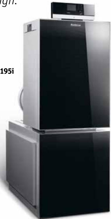
Buderus Logano plus KB195i