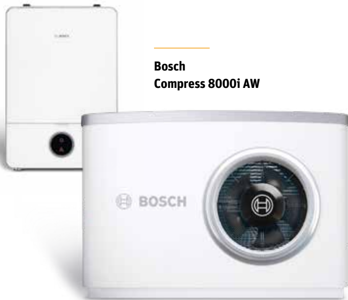
Bosch Compress 8000i AW

Mit den Compress-Geräten bringt Bosch eine neue Wärmepumpen-Generation auf den Markt, während Buderus mit dem neuen Vormischbrenner Logano plus KB195i aufwartet. Die kompakten Einheiten arbeiten äusserst effizient und erfüllen hohe Ansprüche an das Design.